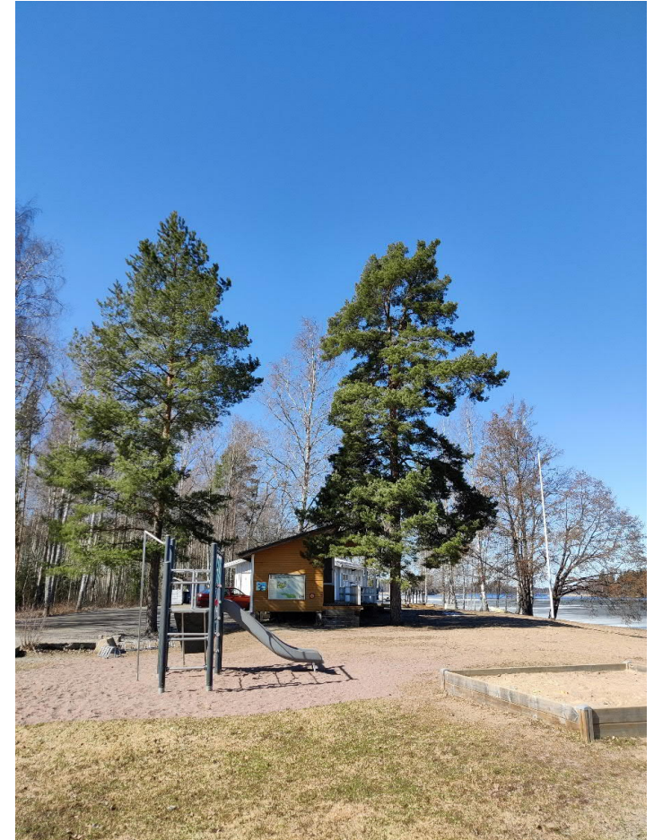
Pyöräpysäköinti sijoitetaan keskeiselle paikalle saunan ja pukukoppien luokse.

Siirtymisen sataman toimintojen välillä halutaan olevan mahdollisimman helppoa, ja siksi kauempana sijaitsevilta pysäköintialueilta tehdään mahdollisimman suorat polut satamaan ja uimarannalle. Lisäksi vanhat luontopolut säilyvät alueella.