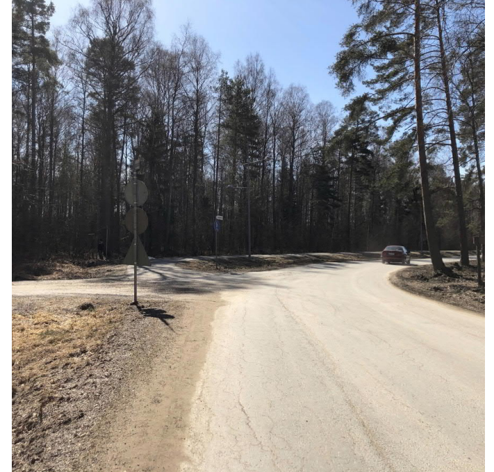
Kangassaarentien tietä tullaan levennetämään ja Kangassaarentien ja Satamatien liittymän hierarkiaa selkeytetään. Jalankulku- ja pyöräväylä jatketaan Satamatien yli rannalle asti.