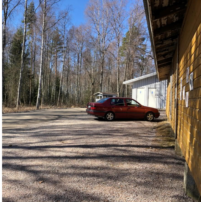
Jatkossa saunalla pysäköi polkupyörien lisäksi vain invapysäköinti ja huoltoajo.

Satamatie levennetään 6,5 metriseksi, jotta linja-autot mahtuvat kohtaamaan tiellä. Tien nykyinen 60 km/h rajoitus alennetaan 50 km/h yleissuunnitelma-alueen alusta ja 30 km/h nykyisestä Kangassaarentien ja Satamatien liittymästä lähtien kummallakin kadulla. Satamatien ja nykyisen Kangassaarentien liittymää selkeytetään niin, että jatkossa vanha Kangassaarentie säilyy entistä selkeämmin pääsuuntana. Satamatien pää liittymästä TMVK:lle säilyy 5 m leveänä sorapintaisena tienä, mutta sen routavauriot tulee kunnostaa. Pääsuuntana säilyvä vanha Kangassaarentie levennetään myös 6,5 metriseksi, ja se asfaltoidaan pysäköintialueelle asti.