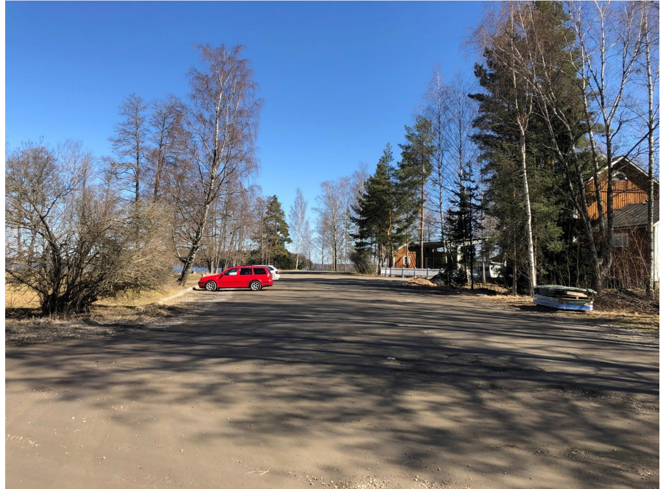
P1 nykytilanteessa. Pysäköintialuetta tullaan kaventamaan ja selkeyttämään.

Matkailuautoparkin eteläpuolella on nykyisin trailereiden pitkäaikaisäilytykseen tarkoitettu pysäköintialue, P4. Pysäköintialue ei kuulu yleissuunnitelman alueeseen, mutta se voidaan ottaa kesäkäyttöön ja ohjata rannan pysäköintiä sinne vilkkaimpina päivinä. Etäisyys satamaan on n. 250 m. Matkailuautoparkin pohjoispuolelta tehdään polku satamaan. Pysäköintialuetta tarvitaan ainakin niin kauan, kunnes P3 on rakentunut, ja senkin jälkeen ainakin bussien pysäköintiin.