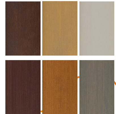
Kuvat: Terveysaseman sisämateriaaleja, ikkuna-aukkojen koristeaiheita, pyöräkatosis vasten valettua betonipintaa julkisivuvissa Vahanan Oy, terveysaseman katos Anniina Grönholm, esimerkkejä kuultokäsitellyistä värisävyyistä Tikkurilan Valtti –Kuultotuotteet ja puuöljyt värikartta