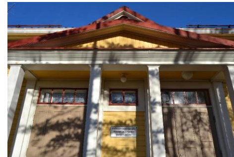
Kuva: Kulkutautisairaalan sisäänkäynti, Heilu Oy Kristian Tuomainen