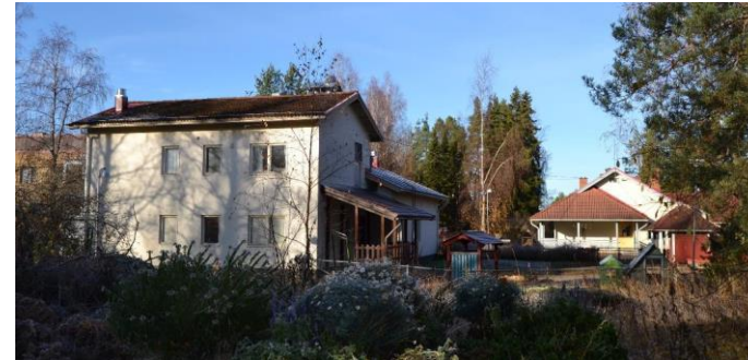
Kuva: Ruotsalaistalot, Heilu Oy Kristian Tuomainen