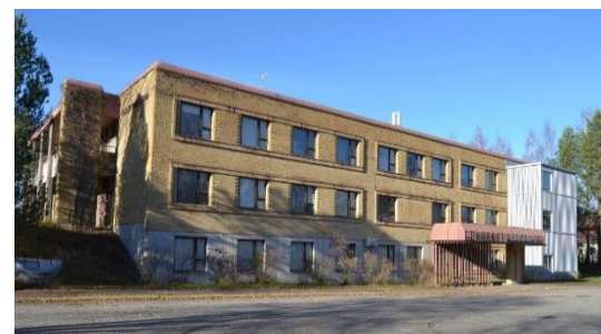
Kuvat: Vanha terveysasema, ruotsalaistalo Heilu Oy Kristian Tuomainen, muut Anniina Grönholm