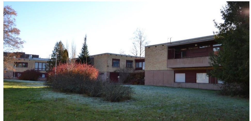
Kuva: Hakalehdon vanhainkoti, Heilu Oy Kristian Tuomainen