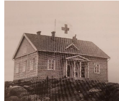
Kuva: Kulkutautisairaala, Akaa-Toijala seura, kirjasta Akaan historia III

Kuva: Klassismin värikartta, Tikkurila Oy ( https://tikkurila.fi/pro/varit/perinnevarit/klassismi-1920-luku )