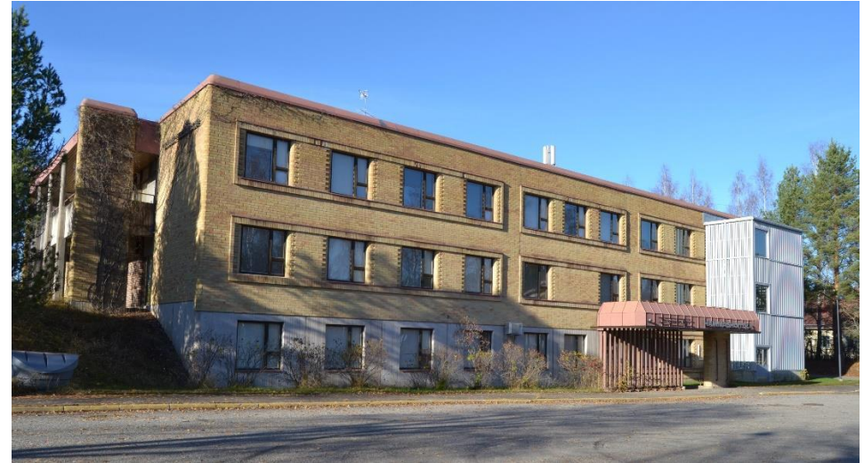
Kuva: Toijalan vanha terveysasema, Heilu Oy Kristian Tuomainen

Rakennustaiteellisesti tai kulttuurihistoriallisesti arvokas rakennus, jota ei saa purkaa. Korjaustyössä rakennuksen ulkoasu tulee säilyttää noudattamalla alkuperäisiä rakennustapoja ja arkkitehtuuria. Sisätilojen muutos- ja korjaustyössä tulee säilyttää alkuperäinen sisätilojen tunnelma mahdollisimman suurilta osin.