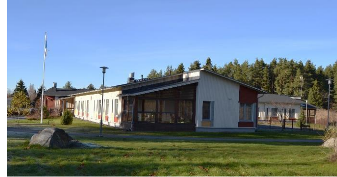
Kuva: Torkonkartano, Heilu Oy Kristian Tuomainen

Tontilla 4 sijaitsevat nk. Ruotsalaistalot. Ruotsalainen Hallsbergin kummikunta lahjoitti Toijalalle kaksi miljoonaa markkaa terveystalon ja päiväkodin rakentamiseen. Rakennukset valmistuivat 1949. Alun perin päiväkotikäyttöön valmistunutta rakennusta on laajennettu 2002. Alkuperäiset Ruotsalaistalot ovat julkisivuiltaan vaaleaksi rapattuja, kattomuodoltaan symmetrisiä harjakattoja ja katemateriaaliltaan tiiltä. Lisärakentaminen ja muutostyöt tontilla tulee sopeuttaa ruotsalaistalojen tyyliin, värisävyihin ja materiaaleihin. Julkisivumateriaalina voi käyttää ilmastotavoitteiden mukaisesti myös vaaleaksi maalattua puuverhousta. Värimaailmaa suunniteltaessa tulee käyttää esimerkiksi jälleenrakennuskauden värisävyjä.